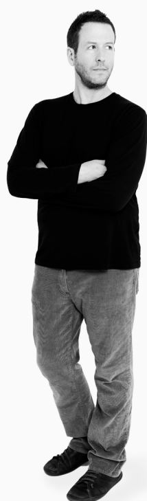
brad ascalon — DESIGNER

“In the end I want to achieve that perfect balance, an uncomplicated solution, and a design that doesn’t stand out but rather blends into its environment.”